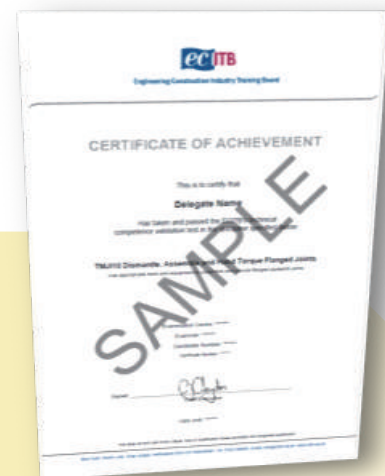
CoA(Certificate of Achievement)