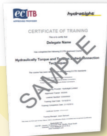
CoT(Certificate of Training)